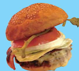
コーラル・バームス・アイランド・リゾート