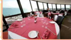
ラマダ・レストラン 360°

ラマダプラザの最上階にある高級フレンチ。1時間かけて町を展望できる人気の回転レストランです！